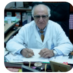
Pr. HADDAD MUSTAPHA PRÉSIDENT D'HONNEUR DES JOURNÉES