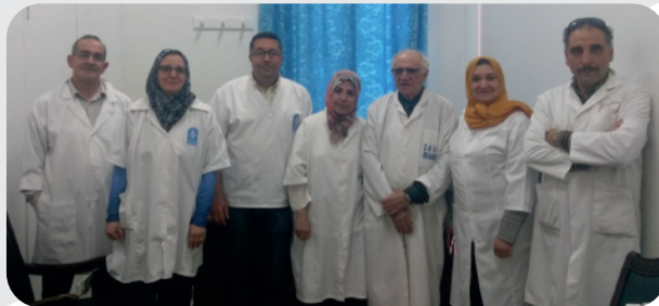
SUR LA PHOTO DE GAUCHE A DROITE